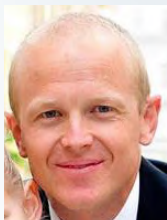
by Rev. James Pace Missionary, Vienna, Austria

Over the last 4 centuries the meter has had slightly different measurements based upon widely differing sources. These minute differences aren't so noticeable when measuring draperies, but when making calculations concerning traveling to the farthest expanses of space they can mean life or death. I suppose the same could be said about what we use as our measurement for entrance into heaven. We can try to use many different things, but God's word is always best. "For ever, O LORD, thy word is SETTLED in heaven." ~ Psalms 119:89