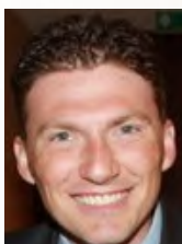
by Rev. Charles Robinette General Superintendent - Vienna, Austria

Apostolic leaders, don't hide from your failures. Don't live behind a mask! Don't make the same mistake Samson made! Live a life of truthfulness with God, others & yourself and witness the power that comes from it!