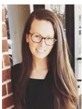
by Sis. Whitney Bateman AlMer - Vienna, Austria

We have a brand new generation of preachers, pastors, evangelists, and teachers rising up – who are not just hearers of the Word, but doers. The Youth of the GSN: Future (and current) Heroes of the Faith!