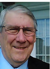
by Rev. Tony Gratto

The people who walk with God will always reach their destination. Like Gaius, let our lives portray what it really means to walk in the Power of Truth.