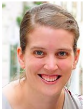
by Sis. Harmony Pace Missionary, Vienna, Austria

May we unleash the power of Truth in our everyday lives by applying it. As we do, it will demand that we share it - giving others the opportunity also.