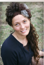
by Sis. Stacey Robinette Missionary - Vienna, Austria

Everyday we should claim the promises that are written in the Bible over our homes, over our churches and over our families. We must activate the truth and power of Gods word.