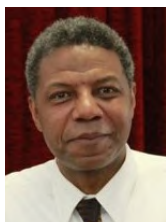
by Rev. Ernest Scott Pastor - Nürnberg, Fürth

Example: [3] And when the tempter came to him, he said, If thou be the Son of God, command that these stones be made bread. [4] But he answered and said, It is written , Man shall not live by bread alone, but by every word that proceedeth out of the mouth of God. [5] Then the devil taketh him up into the holy city, and setteth him on a pinnacle of the temple, [6] And saith unto him, If thou be the Son of God, cast thyself down: for it is written , He shall give his angels charge concerning thee: and in their hands they shall bear thee up, lest at any time thou dash thy foot against a stone. [7] Jesus said unto him, It is written again, Thou shalt not tempt the Lord thy God. [8] Again, the devil taketh him up into an exceeding high mountain, and sheweth him all the kingdoms of the world, and the glory of them; [9] And saith unto him, All these things will I give thee, if thou wilt fall down and worship me. [10] Then saith Jesus unto him, Get thee hence, Satan: for it is written , Thou shalt worship the Lord thy God, and him only shalt thou serve. Matthew 4:3-10 *It is so simple but we have missed it or even maybe forgotten. Follow JESUS example as the Word and Truth!!!