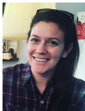
by Sis. Christine Duke AllMer - Vienna, Austria

Telling the truth and telling a lie both have consequences, one leads to freedom and the other leads to bondage. Do you want to be free or in bondage?